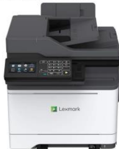
Scatti sopra l'immagine per ingrandirla

Stampanti e accessori > Stampanti a getto d'inchiostro a laser > Stampanti laser